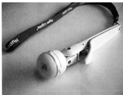
医療機関向けプロ用ポケットライト